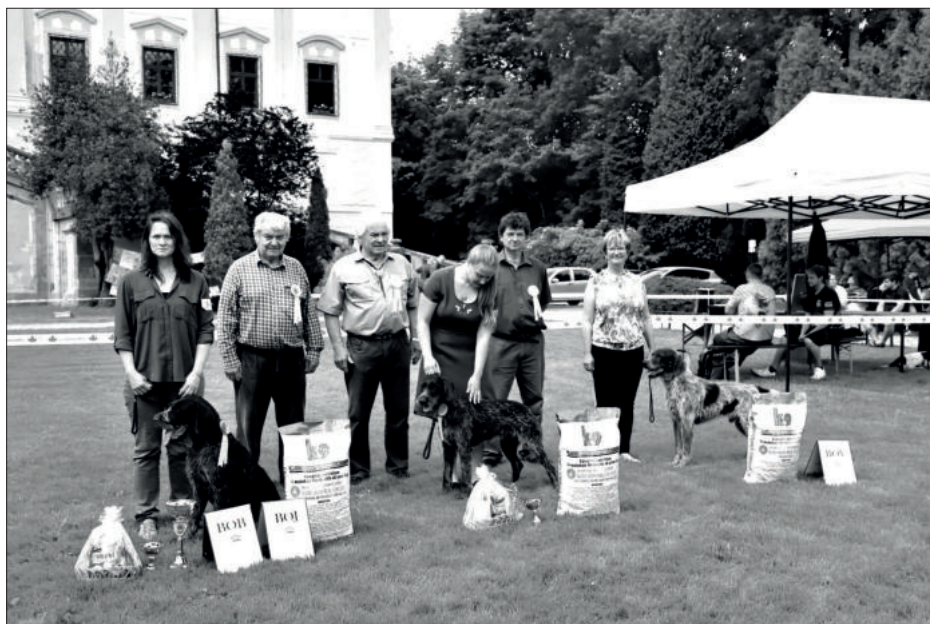
Nejlepší jedinci speciální klubové výstavy