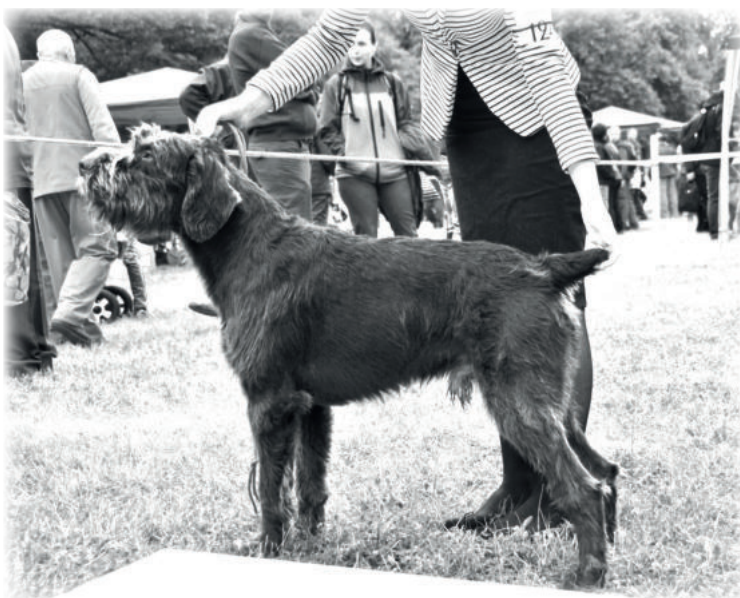
chovný pes At Vlasmina, II linie

Aktuální seznam chovných psů, změny v seznamu chovných psů a karty jednotlivých chovných psů včetně fotografií jsou u hlavního poradce chovu, a informativně jsou uvedeny na www.cesky-fousek.cz