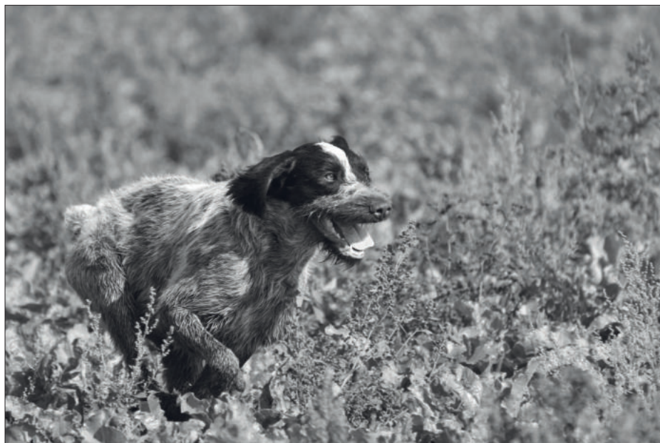
Ben ze Dvora v lese, chovný pes - linie I mem. Dr. Khuna 2018

Speciální výstava CAC - OMS Chomutov, Červený Hrádek 1.6. 2019 rozhodčí: Ing. Braňka, Štich