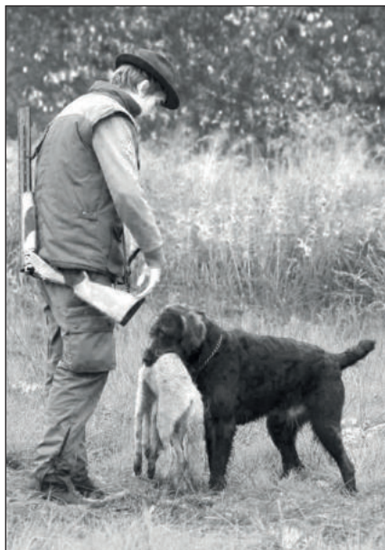
Lesan z Koblova, bývalý chovný pes, linie I.